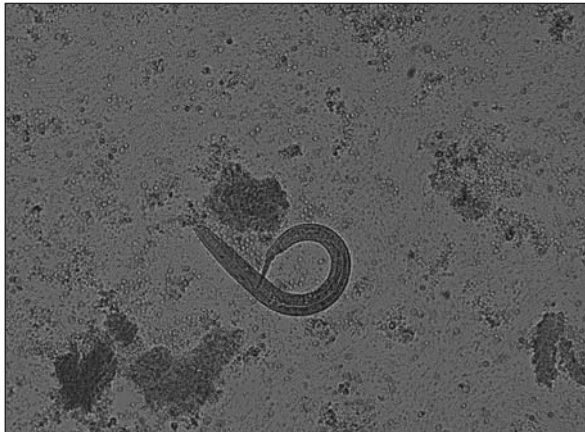
Figura I. Larva rhabditoide di Strongyloides stercoralis (20 X 10) osservata al MO dopo FEA; si distinguono la cavità buccale corta e le due strozzature a livello esofageo.