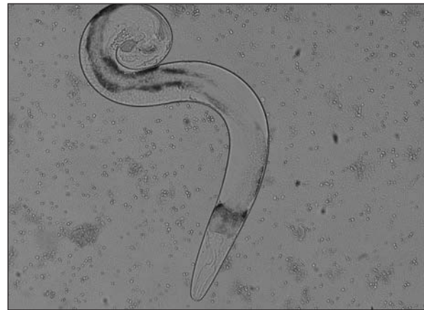
Figura III. Adulto maschio di Strongyloides stercoralis (10 X 10) osservato al MO dopo esame colturale caratterizzato dall'estremità caudale ricurva su se stessa.